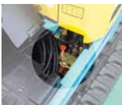
スーパーチェンジ

操作パターンが他社方式に簡単に切り替え可能。また、4つの操作パターンに切り替えることもできます。