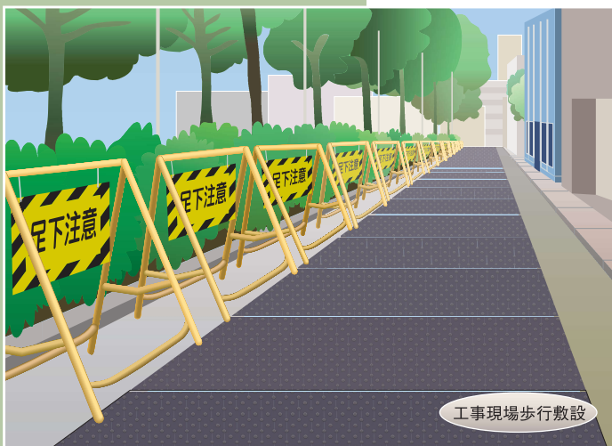
工事現場歩行敷設