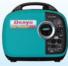
GE-1400SS-IV P3 GE-1600SS-IV P4