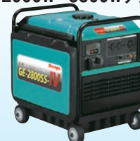
GE-2500-IV P5 GE-2800SS-IV P6 GE-2800-IV P5 GE-3800SS-IV P6 GE-2500SS-IV P6 GE-5500SS-IV P6

※上記の表は、一例ですので実際にご使用されている機器と異なる場合がありますので、必ずご使用前に消費電力を確認して下さい。 ※使用される機器によっては、マッチングしない場合もありますのであらかじめご確認下さい。