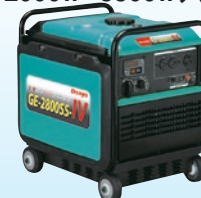
GE-2500-IV P5 GE-2800SS-IV P6 GE-2800-IV P5 GE-3800SS-IV P6 GE-2500SS-IV P6 GE-5500SS-IV P6

※上記の表は、一例ですので実際にご使用されている機器と異なる場合がありますので、必ずご使用前に消費電力を確認して下さい。 ※使用される機器によっては、マッチングしない場合もありますのであらかじめご確認下さい。