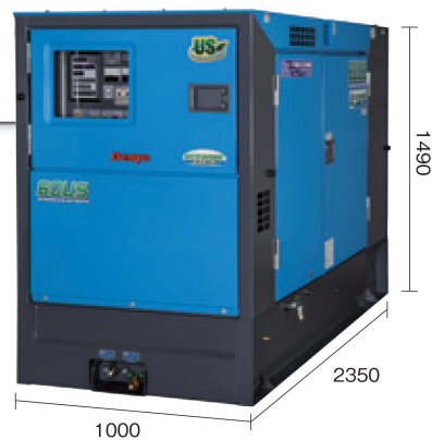
●コントロールパネル/エンジンモニター